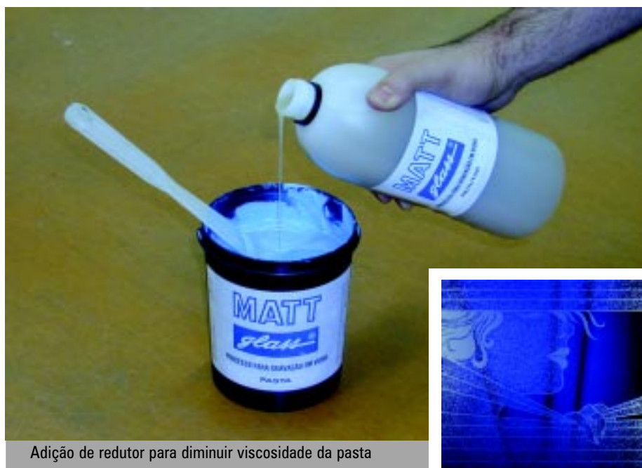
Adição de redutor para diminuir viscosidade da pasta

Ajustar a matriz, para permitir um fora contato durante a impressão de