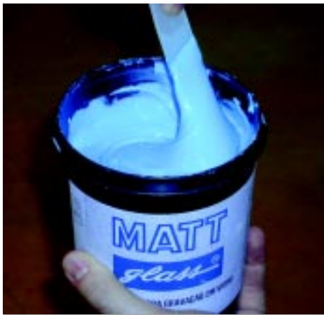
Processo de agitação da pasta

utilizarmos outros tipos de tintas, mesmo as tintas epóxi de dois componentes, a aderência não será permanente e a impressão sairá com o tempo.